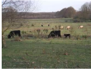
Plantage Willem III